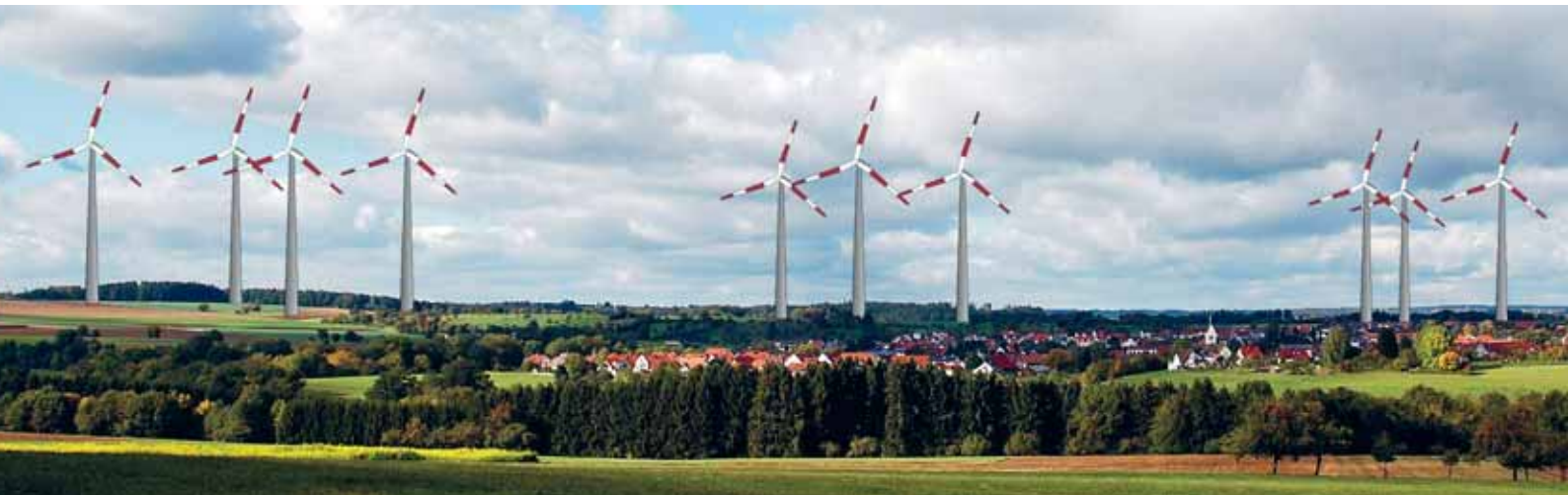
▲ Kulturlandschaft der Zukunft? Ein Szenario zu geplanten Windkraftstandorten am Rande der Schwäbischen Alb. Das alte staufische Kulturland ist zugleich Erholungsgebiet des Verdichtungsraums Stuttgart/Mittlerer Neckar.