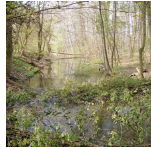
« Giessen » (srce alluviale)