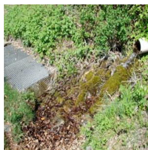
srce mise sous tuyau et captée