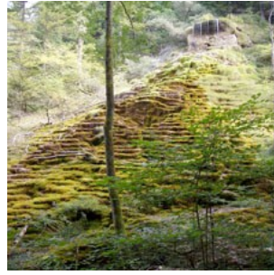
eucalcique (à tuffes)